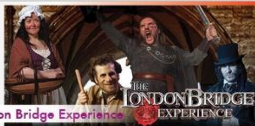
London Bridge Experience