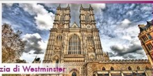
Abbazia di Westminster