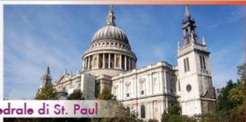
Cattedrale di St. Paul