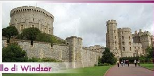
Castello di Windsor