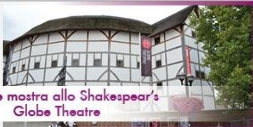
Tour e mostra allo Shakespeare's Globe Theatre