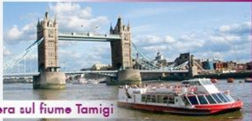
Crociera sul fiume Tamigi

Il nostro programma VISIT LONDON ti porta ogni giorno in visita guidata verso tutte le maggiori attrazioni di Londra come: