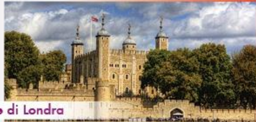
Torre di Londra