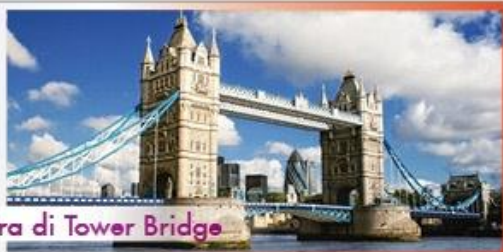
Mostra di Tower Bridge