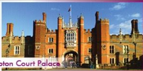
Hampton Court Palace