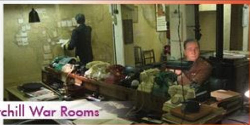
Churchill War Rooms